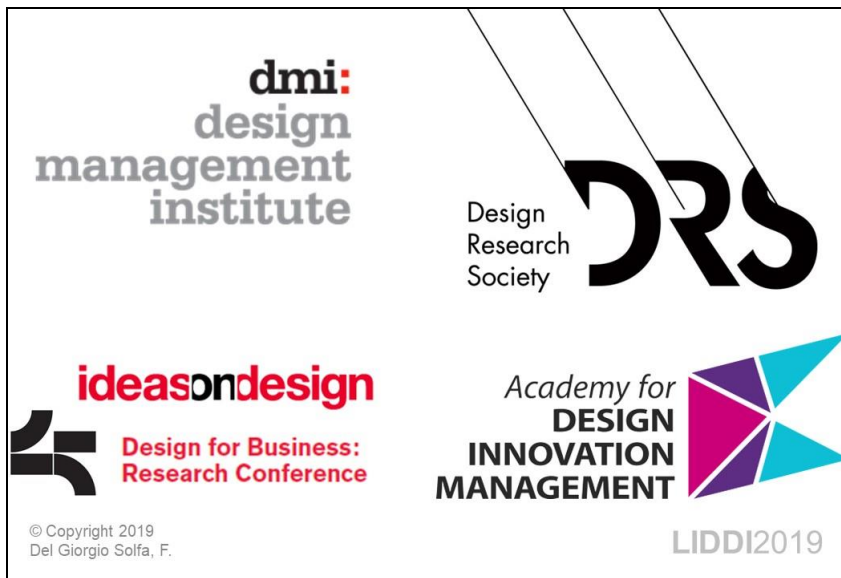
Figura 1. Marco teórico principal

Nota: Esta imagen el marco teórico principal y fue presentada en el Encuentro LIDDI 2019 (Facultad de Artes, UNLP).