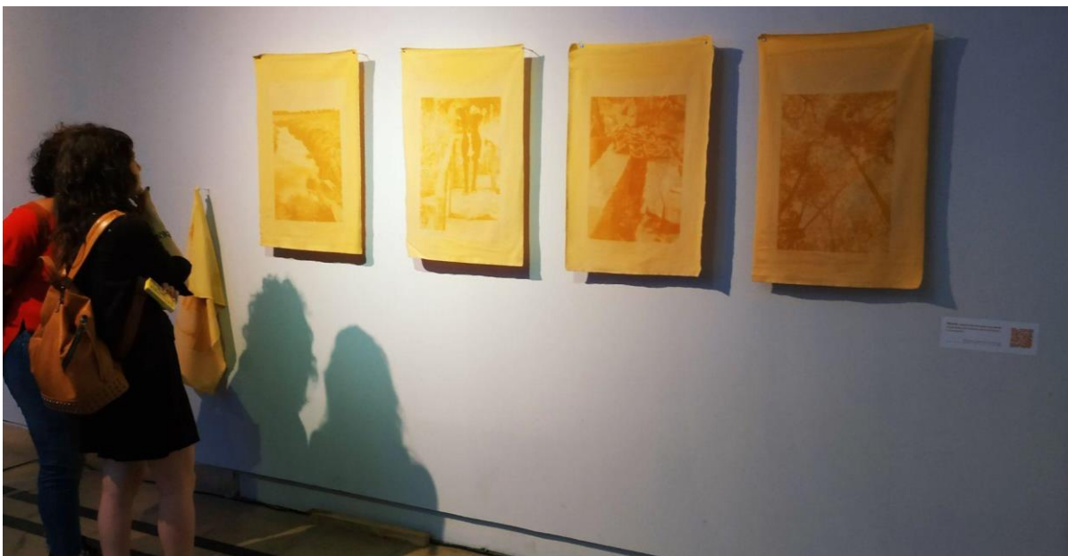
Figura 4. Morar , Cátedra de Fotografía e Imagen Digital. 9na Muestra de Cátedras del Departamento de Plástica, Museo de Arte Contemporáneo Latinoamericano. https://feidfa.wixsite.com

La presentación de la obra se realizó en el Museo de Arte Contemporáneo Latinoamericano, ubicado en el Pasaje Dardo Rocha de La Plata, en el marco de la 9na Muestra de Cátedras del Departamento de Plástica Sin título , en octubre de 2019. El montaje consistió en cuatro piezas de tela de aproximadamente 50x70cm suspendidas a 5 cm de la pared, lo cual permitía un ligero movimiento de las mismas producto del paso de los espectadores durante el desarrollo de la muestra. Acompañamos esta serie con otras piezas de prueba descartadas, plegadas de manera irregular de un único gancho, poniendo en valor el carácter procedimental de esta técnica. Este procedimiento de copia directa, si bien permite una réplica infinita del motivo, al mismo tiempo plantea una imposibilidad de generar imágenes idénticas entre sí, dado que entra en juego las variables presentes durante el proceso de emulsionado y las cualidades del tinte fotosensibles preparado [Figura 4].