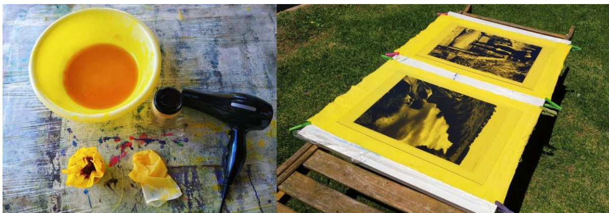
Figura 2. Morar , Cátedra de Fotografía e Imagen Digital. Producción de tinte fotosensible y armado de contactera. https://feidfa.wixsite.com

En el marco de las prácticas de investigación desarrolladas en el proyecto Revelar, el equipo de Cátedra FeID llevó a cabo la producción artística titulada MORAR durante el año 2019. La propuesta inició con un registro fotográfico realizado por el equipo docente en el barrio Arco Iris de Punta Lara, partido de Ensenada. Dicho barrio nace en el año 1982 a partir de un loteo en el que actualmente viven más de veinte familias que se dedican a la agricultura ecológica de autoconsumo, y que cuenta con caminos de acceso que lo conectan con el centro urbano, así como con canales de riego y acceso al agua a través procesos manuales de potabilización. La actividad se focalizó en un recorrido por el territorio y su relevamiento, registrando el entorno de los habitantes y sus formas de vida, sus procesos de cultivos y cría de animales. Posteriormente se procedió a la selección de las fotografías, destacando aquellas que representaban la esencia de la visita y la experiencia vivida. Un total de cuatro imágenes fueron escogidas para su edición digital y posterior impresión en filminas de gran tamaño, las cuales funcionaron como matrices para el proceso de revelado fotográfico con la técnica de antotipia.