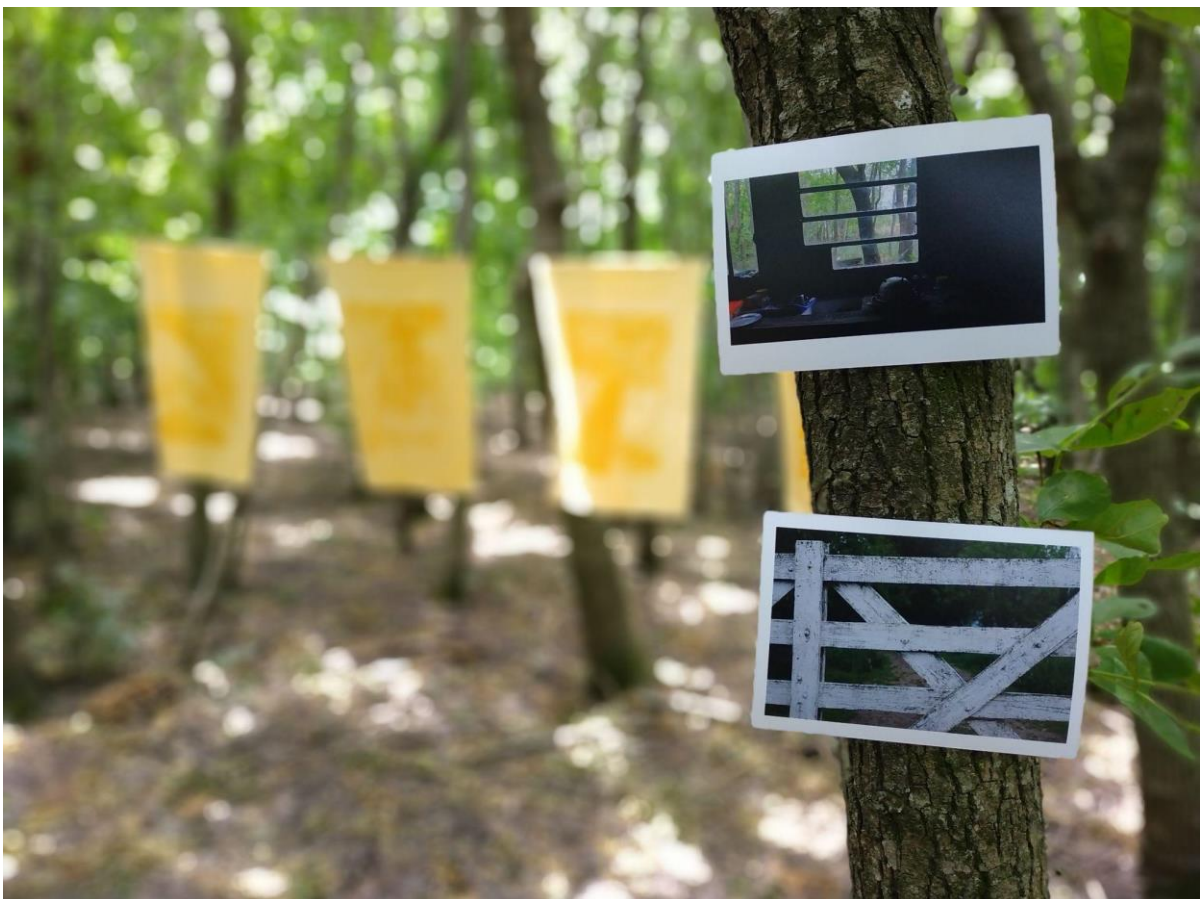
Figura 5. Morar , Cátedra de Fotografía e Imagen Digital. Barrio Arco Iris de Punta Lara, partido de Ensenada. https://feidfda.wixsite.com

En ambas muestras se entregaron tarjetas con códigos QR que funcionaron como vínculo a información complementaria que se encuentra alojada en la página web de la cátedra. Para la muestra en el MACLA, las tarjetas ofrecían el acceso al relevamiento fotográfico del barrio y el proceso de revelado de las antotipias. De igual modo, en la exposición realizada en territorio, se amplió el material ofrecido en las tarjetas QR, sumando el registro de la obra en la galería y su proceso de montaje. Este diálogo entre el espacio legitimado del arte y el espacio comunitario autogestivo enriqueció los intercambios entre los diferentes entornos de circulación de la obra. La creación de estos puentes digitales hacen eco de estas redes creadas entre los ámbitos académicos y el territorio [Figura 5].