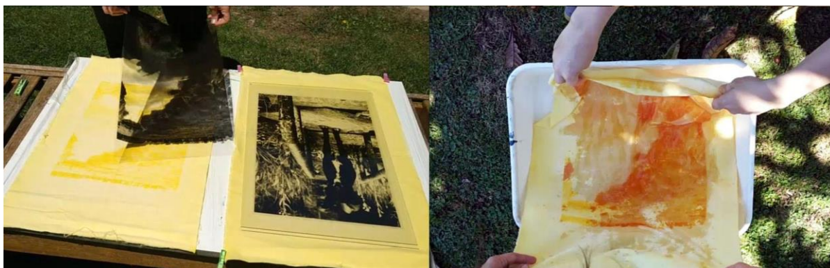
Figura 3. Morar , Cátedra de Fotografía e Imagen Digital. Exposición a la luz solar y baño en borato de sodio. https://feidfda.wixsite.com