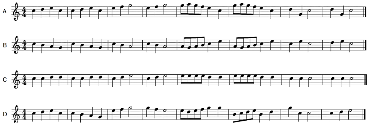
Figura 1: Melodía original de La lechuza (A) y 3 versiones con modificaciones en las alturas (B, C y D).

Para la canción Arroz con leche se realizaron modificaciones en las figuras rítmicas que afectaron especialmente los agrupamientos, el tipo de comienzo y el compás. La opción A presentaba la melodía original; la opción B presentaba una distribución diferente de negras y corcheas, aunque mantenido el compás; la opción C presentaba un ritmo contrastante para el antecedente y el consecuente, que afectaba el compás; y la opción D comprendía un compás para cada verso (excepto el primer verso que presentaba un comienzo anacrúsico y entonces tomaba más de un compás) y presentaba coincidencias entre el agrupamiento gráfico de las corcheas y el texto de la canción (por ejemplo estaban unidas por una barra las corcheas que correspondían a las sílabas de una misma palabra), (véase Figura 2).