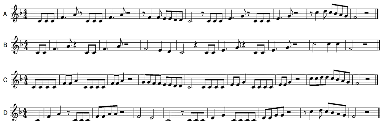
Figura 3: Melodía de La cucaracha (A) y 3 versiones con modificaciones en el ritmo (B, C y D)