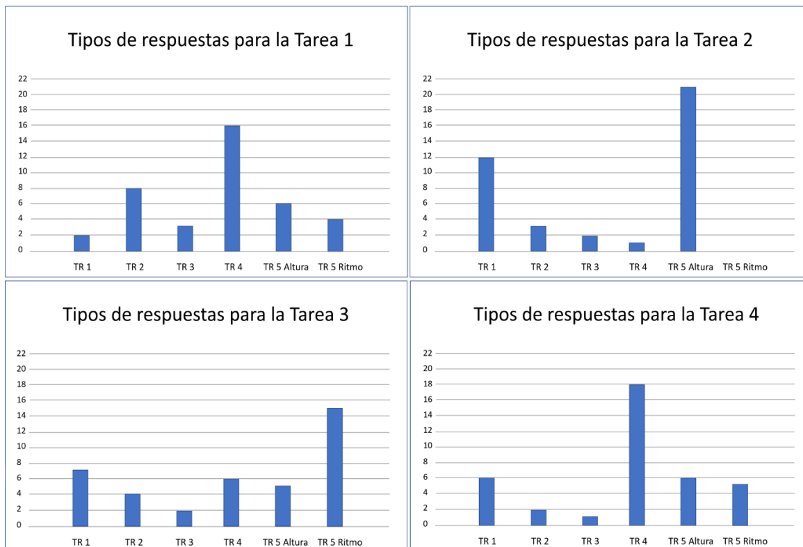
Figura 5: Distribución de los tipos de respuestas para cada una de las tareas.

En la tarea 2, cuyas partituras presentaban versiones para la canción La lechuza que afectaban principalmente las alturas, los sujetos tendieron a hacer foco en ese atributo. Como podemos observar en el gráfico, las respuestas de tipo 5 que referían a la altura fueron las más frecuentes. Las justificaciones proponían: “coincide cuando la canción hace más agudo o más grave”, “sube y baja igual que la canción” o “por los tonos de la canción”. En algunos casos el uso invertido de la representación espacial los llevó a elegir y justificar la partitura B.