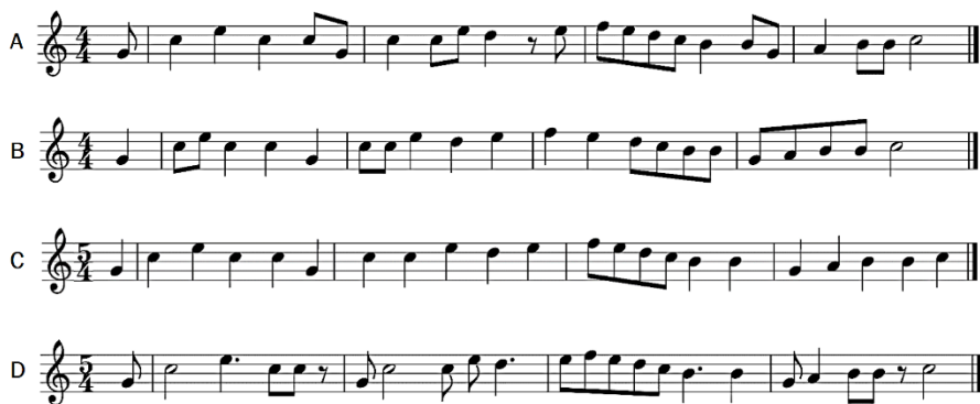
Figura 2: Melodía de Arroz con leche (A) y 3 versiones con modificaciones en el ritmo (B, C y D)

Para la canción Arroz con leche se realizaron modificaciones en las figuras rítmicas que afectaron especialmente los agrupamientos, el tipo de comienzo y el compás. La opción A presentaba la melodía original; la opción B presentaba una distribución diferente de negras y corcheas, aunque mantenido el compás; la opción C presentaba un ritmo contrastante para el antecedente y el consecuente, que afectaba el compás; y la opción D comprendía un compás para cada verso (excepto el primer verso que presentaba un comienzo anacrúsico y entonces tomaba más de un compás) y presentaba coincidencias entre el agrupamiento gráfico de las corcheas y el texto de la canción (por ejemplo estaban unidas por una barra las corcheas que correspondían a las sílabas de una misma palabra), (véase Figura 2).