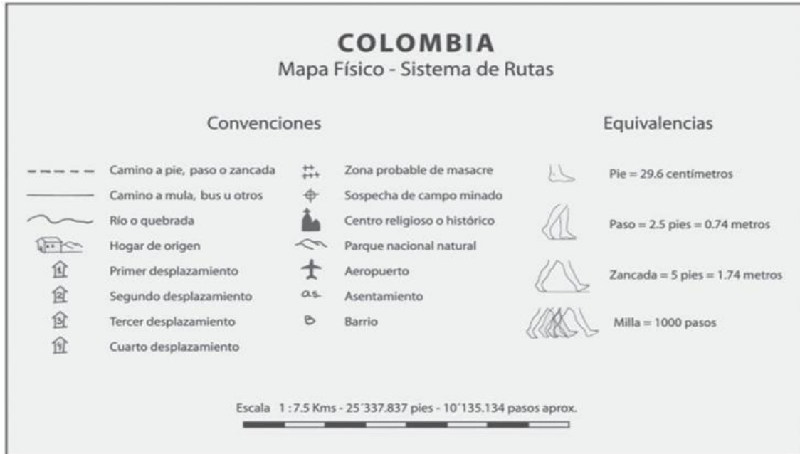
Figura 2. Signos cardinales – Cuadernos de geografía (2008), de Libia Posada