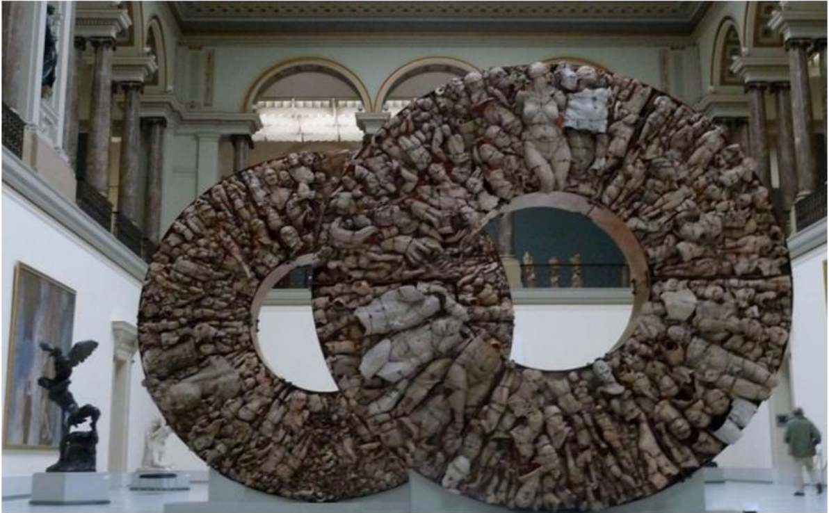
Figura 4. Chalchihuites. Dos gotas de agua (2007), de Javier Marín