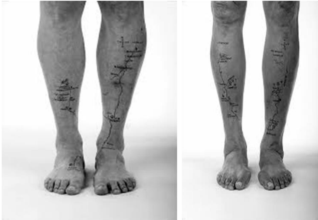
Figura 1. Signos cardinales – Cuadernos de geografía (2008), de Libia Posada