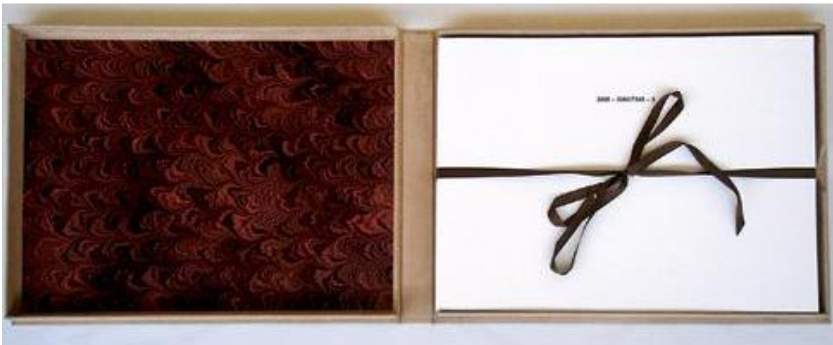
Rosângela Rennó Gomes. 2005-510117385-5 Um livro de artista . Libro de artista. 2008-2009

Comenzando con el primero de los ejes, podemos decir que en el caso de 2005-510117385-5 Um libro de artista , el recurso con el que trabaja la artista brasilera Rosângela Rennó pareciera ser el archivo. Sin embargo, instala una particular manera de vincular esa categoría con la cuestión de los materiales. En 2005, 946 piezas entre ellas 751 fotografías antiguas del siglo XIX fueron extraídas de grandes colecciones de la Biblioteca Nacional de Río de Janeiro. Este hecho fue llevado a cabo sutilmente por un grupo de coleccionistas que mapearon colecciones de fotografías aún no digitalizadas, sin clasificar, para luego extraerlas. En esta obra que toma cuerpo en formato de álbum, las 101 imágenes que fueron recuperadas aparecen representadas del reverso, en tamaño real, ordenadas según la fecha de reinsertación. Apelando a una operatoria archivística, Rennó estableció un sistema de clasificación que permitió recuperar una memoria acotada y fiable.