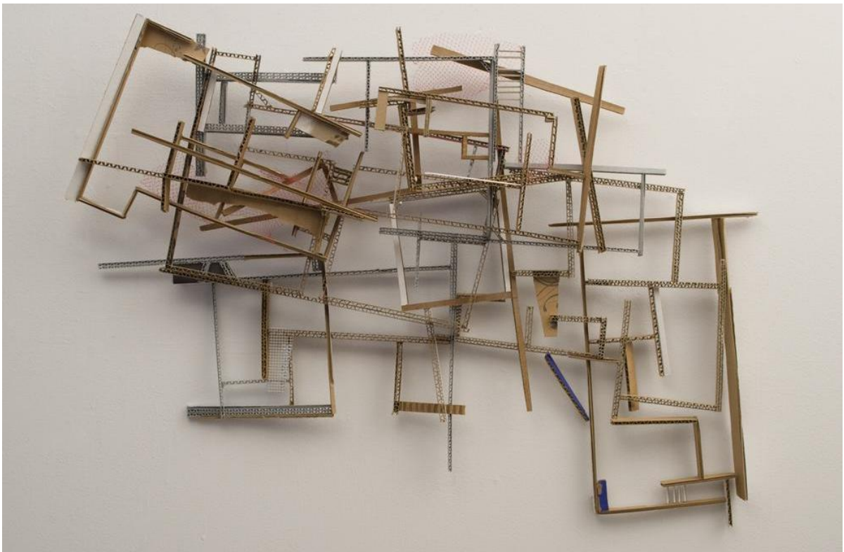
Ana Tiscornia. Des habitaciones (2012) - cartón, papel y pintura, 19" x 28" x 3"

En la obra Des habitaciones de Ana Tiscornia encontramos que el potencial poético radica en la abstracción generada a partir de la búsqueda minuciosa de los materiales y objetos, en la utilización de las herramientas y la combinación de ambas a partir de diversas operaciones posibles en cuanto a la superposición y reordenamiento de las líneas, contornos que delimitan planos. Sus orígenes vinculados a la arquitectura, desde el modo de concepción espacial, le permiten re configurar el espacio ya sea para ser habitado como para ser construido. Su trabajo está centrado en la construcción/deconstrucción de espacios ficticiales a partir de los vacíos que pone de manifiesto en la composición de sus piezas. A través de los diferentes indicadores espaciales con los que acciona el espacio en sus obras, la superposición, la imbricación de los planos perforados o contornos delimitados genera cierto nivel de profundidad sumado a la presencia y ausencia como operaciones antagónicas en permanente tensión.