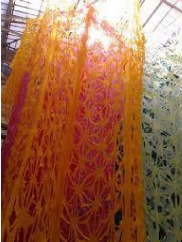
Manuel Ameztoy. Escultura Blanda. Calados sobre textil, 2015.

En sus modos de intervención, es posible reconocer alguna reminiscencia de aquellas esculturas transitables o esculturoarquitecturas incas. A su vez, en la técnica del calado, se manifiesta cierta vinculación con el desbastado/ahuecado como operación sobre el